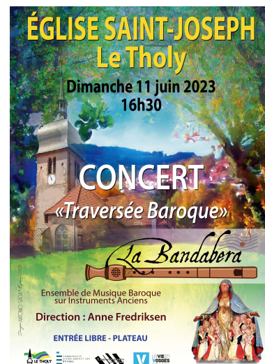
Affiche réalisée par Antonio Gacia en 2023