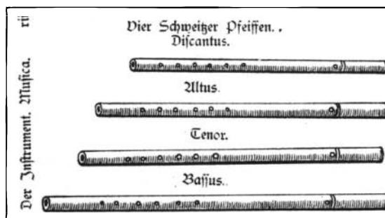
« Musica instrumentalis deudsch » de Martin Agricola (1529 & 1545)

Jusqu'au XVIIIème siècle, le terme « flûte » désigne essentiellement la Flûte à bec alors qu'on ajoute presque toujours, pour la flûte traversière, la désignation de « traversière », « allemande », ou « traverso »... Ce ne sera que dans ce XVIIIème siècle que la flûte traversière deviendra un instrument à part entière avec ses propres spécificités.