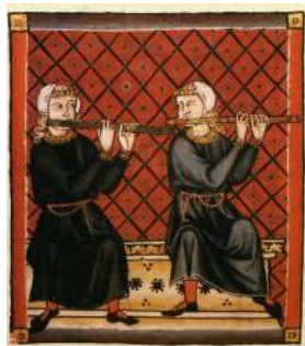
Cantigas de Santa Maria Alphonse X de Castille (1251-1284)

La flûte traversière cylindrique (en latin pipa : allemand pfife ) est courante au moyen-âge parmi les musiciens ( fistulatores ). Elle est répandue dans les cours princières, les musiques militaires, comme dans les cercles bourgeois des villes. A l'inverse de la flûte à bec qui comporte jusque huit instruments de tailles différentes, on ne connaît que peu de formes variées parmi les flûtes traversières (4 chez Agricola 1529-1545 ; 2 chez Ph. Jambe de Fer 1556 et 3 chez Mersenne 1636).